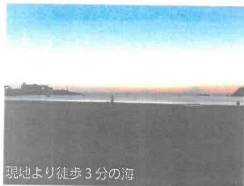
現地より徒歩3分の海

都心へのアクセスの良さ、富士山や夕日を望む景観、緑豊かで昔と今の調和が心地が良い湘南海辺の地。中でも車、電車ともにアクセス抜群の街、逗子にて海辺の物件が登場しました。京浜急行「逗子・葉山」駅と横須賀線「逗子」駅の2路線が利用可。車で逗葉新道を使えば1時間程度で都市部へアクセスが可能。物件より徒歩3分で逗子海岸。朝の散歩は富士山を一望し、夕方になれば美しい夕日を堪能。休日は隣の葉山や鎌倉を散策やマリンスポーツを楽しめます。逗子駅前には活気ある商店街があり生活雑貨、飲食店には困りません。ご自宅用に、リゾート用に、セカンドハウスに。海辺の生活をお楽しみ下さい。